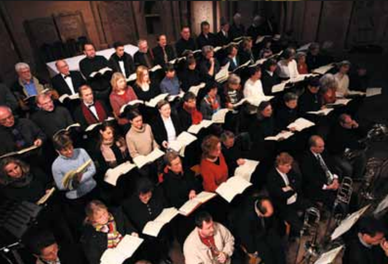
Die Kantorei St. Katharinen bei der Generalprobe zum Requiem von Antonin Dvořák

Nicht nur als Konzertbesucher, sondern auch als Ausübender, Aktiver sind Sie bei uns jederzeit willkommen!